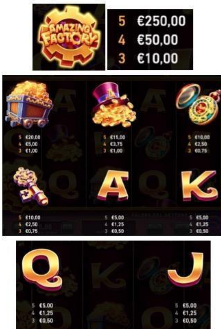
TABELLA DEI PAGAMENTI (relativa ad una puntata di 5 €)