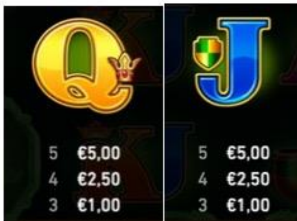
TABELLA DEI PAGAMENTI (relativo ad una giocata da 5,00 €)