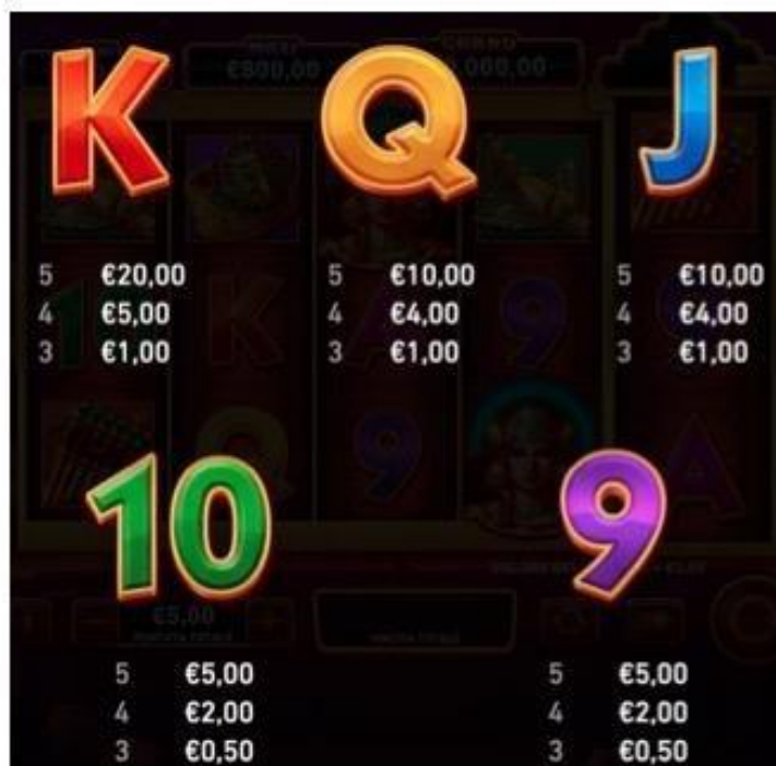
TABELLA DEI PAGAMENTI (relativa ad una puntata totale di 5 €)