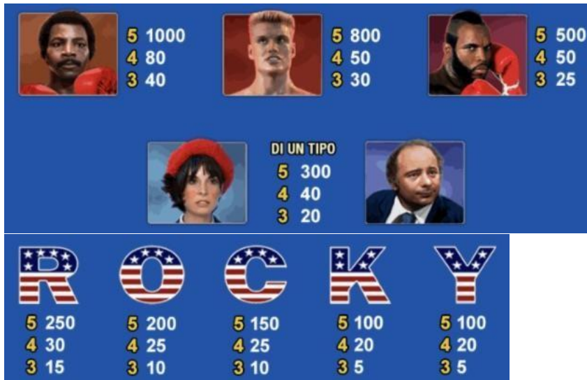
TABELLA DEI PAGAMENTI Simbolo Scatter

Il simbolo SCATTER del gioco è 'Rocky – the Italian Stallion'